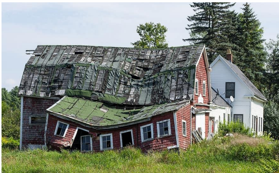
Фиг. 8.4. Пример за сграда, застрашена от самосрутване.

Собствениците на обекти носят имуществена отговорност за причинени вреди и пропуснати ползи от своите виновни действия или бездействия, в резултат на които е настъпила авария на строежа, довела до материални щети или увреждане на трети лица и имоти.