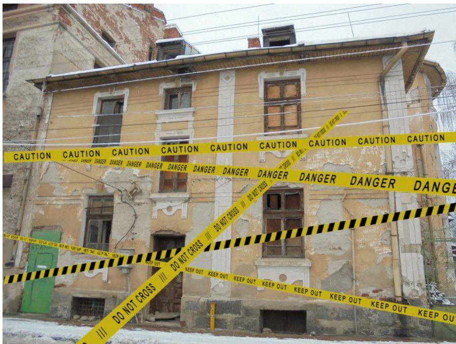
Фиг. 8.3. Пример за сграда в лошо състояние

В случай че обект не се поддържа в добро състояние, както и при възникване на аварии или други обстоятелства, застрашаващи обект с увреждане или разрушаване, кметът на общината издава заповед (по чл. 195, ал. 4 от ЗУТ), с която задължава собственика да извърши в определен срок необходимите ремонтни и възстановителни дейности за поправяне или заздравяване.